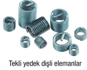
Tekli yedek dişli elemanlar